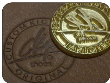
слепое тиснение (блинт)